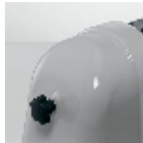
Cut thickness adjusting knob