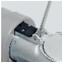
Microswitch on the lever