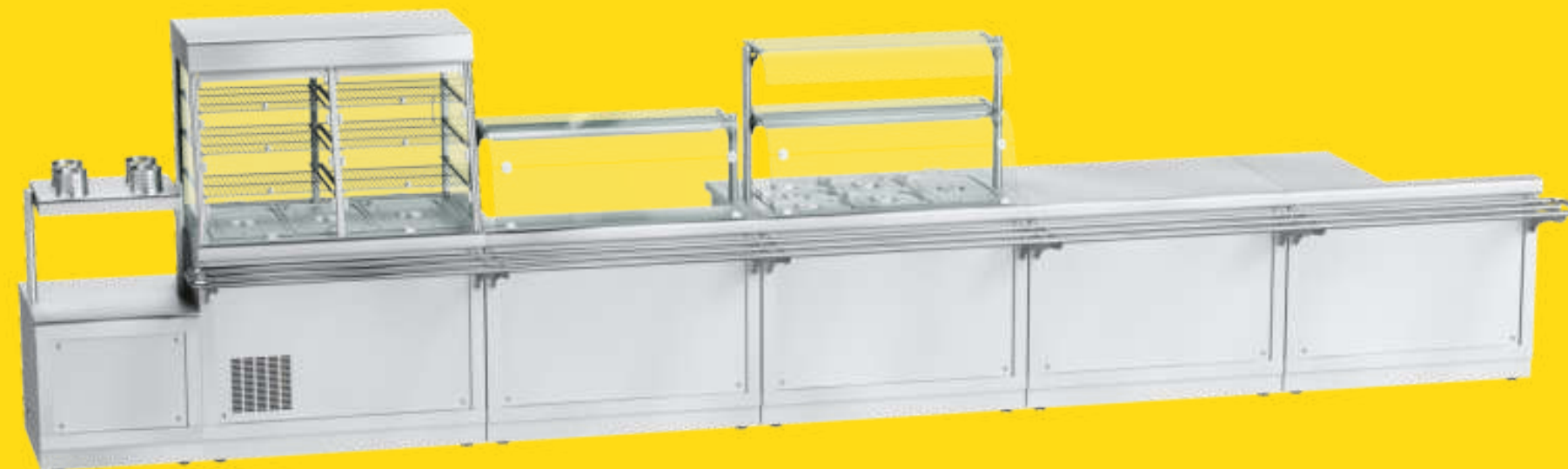
НЕРЖАВЕЮЩАЯ СТАЛЬ (по умолчанию)