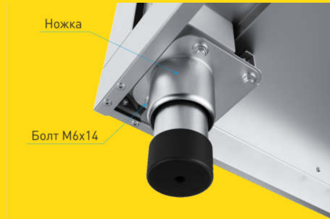
Вид снизу. Демонтаж

Для удобства установки и перемещения изделий