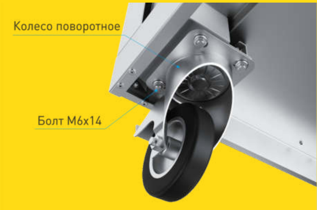
Вид снизу. Установка поворотного колеса