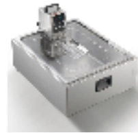
Container 2/1 gastro