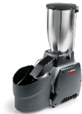
Sirman Измельчители льда , model Nordkapp :

Sirman Spa Viale dell'Industria 9/11 35010 PIEVE DI CURTAROLO (PD), Italy Tel./Fax. +39 049 9698666 / +39 049 9698688 email: info@sirman.com