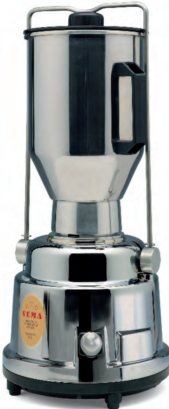
FR 2010 TURBO