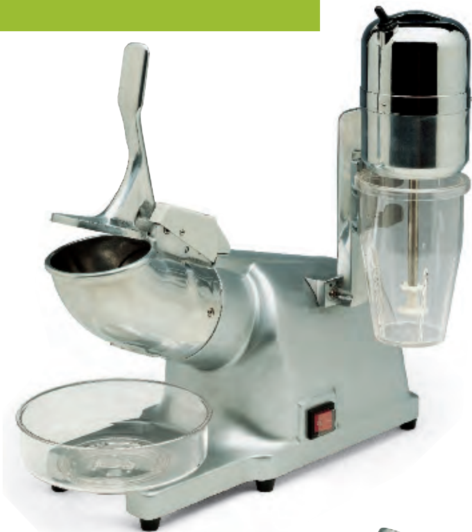
TRFL 2012 con frullino frappè with shaker