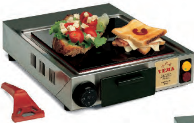
PVF 2079 singolo/single