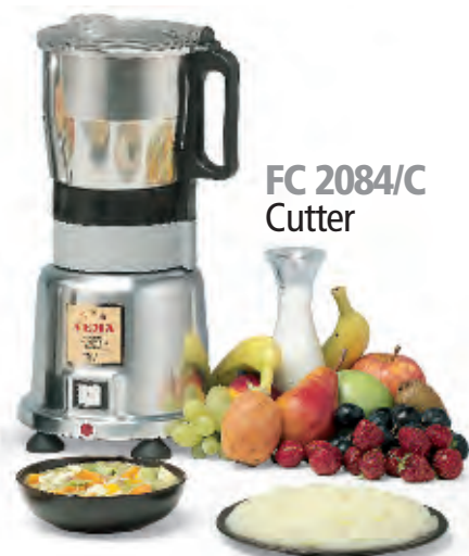
FC 2084/C Cutter

■ Frullacutter con 2 funzioni: Frullatore per uso con base liquida, Cutter per uso anche senza liquido. Le diverse velocità di lavorazione sono attivate dal semplice cambio del bicchiere sulla base in comune. Dotato di 2 bicchieri differenti in acciaio inox (acquistabile anche separatamente il solo cutter con il cod. FC 2084/C) con gruppo lame diversi. Dotato di interruttore a 2 velocità e pulsante per funzionamento intermittente. Ideale, nella funzione Cutter, per realizzare preparazioni non attuabili con il frullatore.