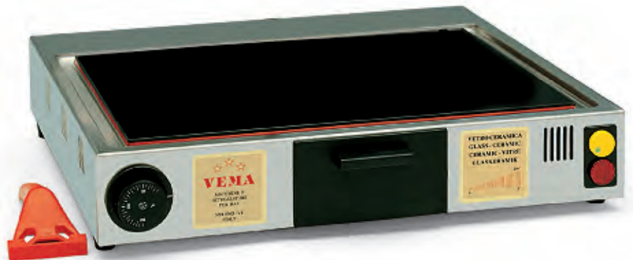
PVF 2046 medio/medium