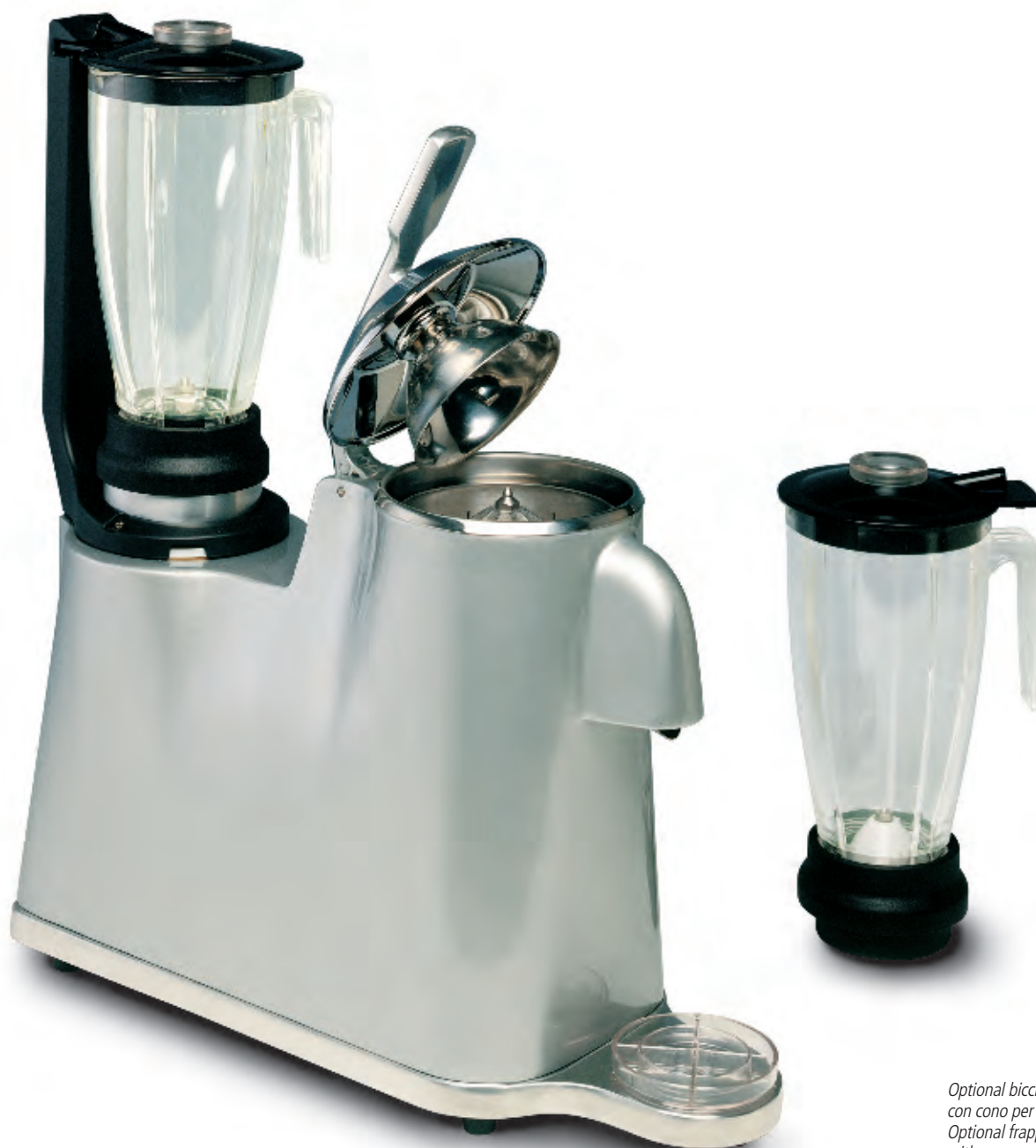
Optional bicchiere con cono per frappé Optional frappé jug with cone