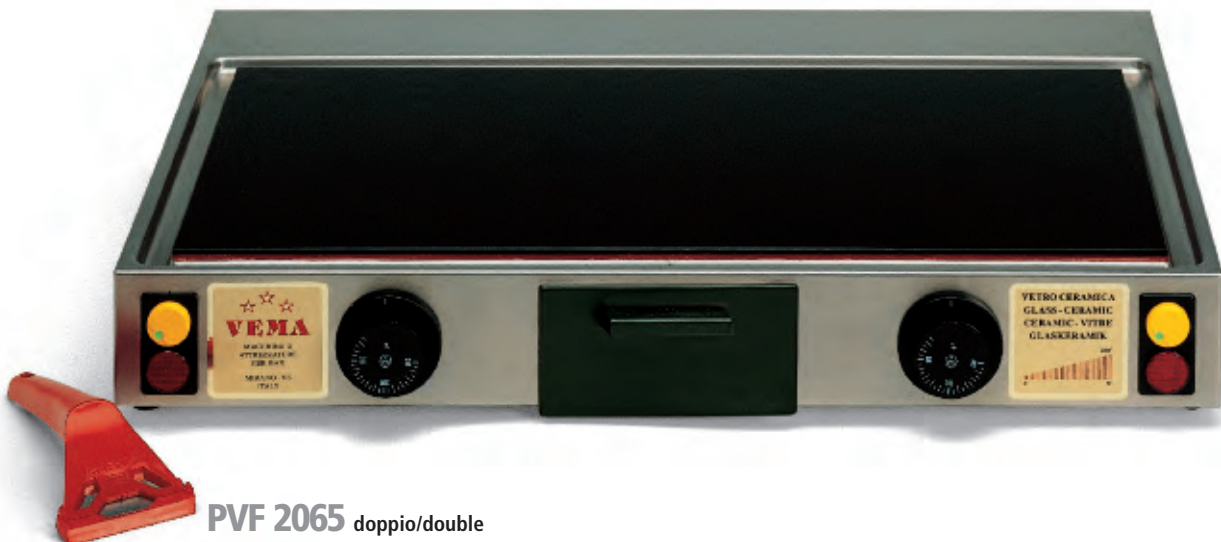
PVF 2065 doppio/double