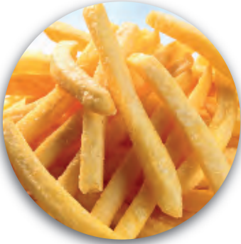
PATATINE FRENCH FRIES