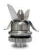
Removable s/steel knives assembly