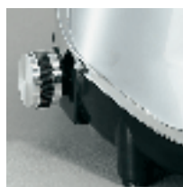
Variable speed device optional