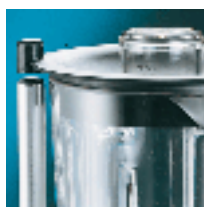
Microswitch on cover