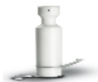
Shaft with knives to mix dough