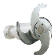
Shaft with knives for pesto sauce