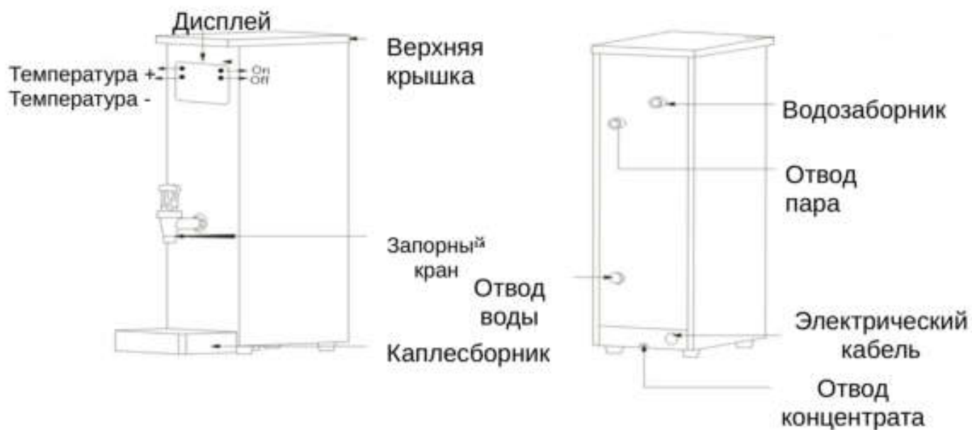
Схема устройства CWB-30/60