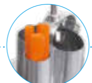
Цилиндрическая воронка Ø 58 мм