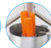
Цилиндрическая воронка Ø 58 мм