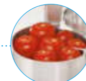
Широкая воронка XL Крупные овощи

R 752 Воронки для фруктов и овощей любых размеров