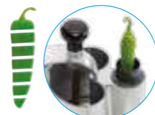
Толкатель Exactitube Ø 39 мм

R 502 Воронки для фруктов и овощей любых размеров