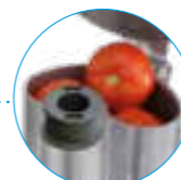
Большая воронка Крупные овощи

R 752 Воронки для фруктов и овощей любых размеров