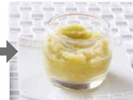
Пюре из свежих яблок гренни смит