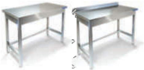
СТОЛ ПРОИЗВОДСТВЕННЫЙ, СТОЛЕШНИЦА ИЗ СТАЛИ AISI 304 С УСИЛЕНИЕМ ЛДСП