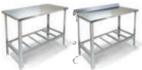
СТОЛ ПРОИЗВОДСТВЕННЫЙ, КАРКАС РАЗБОРНЫЙ – УГОЛОК СТАЛИ AISI 430