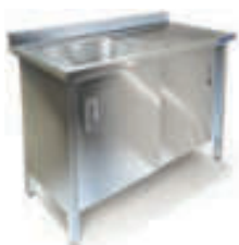
ВАННА МОЕЧНАЯ ЦЕЛЬНОТЯНУТАЯ ОДНОСЕКЦИОННАЯ С КРЫЛОМ И ДВЕРЬМИ ЁМКОСТЬ ИЗ НЕРЖАВЕЮЩЕЙ СТАЛИ AISI 304