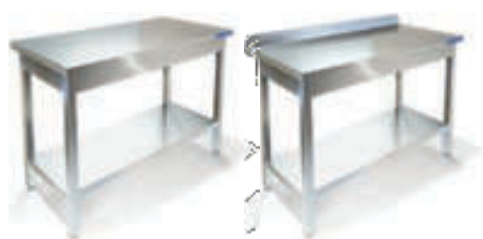
СТОЛ ПРОИЗВОДСТВЕННЫЙ, СТОЛЕШНИЦА ИЗ СТАЛИ AISI 304 С УСИЛЕНИЕМ ЛДСП