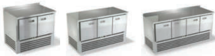
НИЖНИЙ АГРЕГАТ, СТОЛЕШНИЦА НЕРЖАВЕЮЩАЯ СТАЛЬ