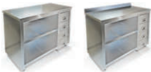
СТОЛ ТУМБА БЕЗ ДВЕРЕЙ (ЗАДНЯЯ СТЕНКА ОЦИНКОВАННАЯ СТАЛЬ)