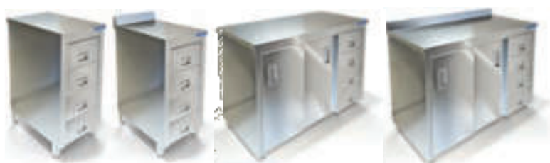
СТОЛ ТУМБА (ЗАДНЯЯ СТЕНКА ОЦИНКОВАННАЯ СТАЛЬ)