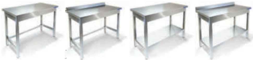
СТОЛ ПРОИЗВОДСТВЕННЫЙ, СТОЛЕШНИЦА И КАРКАС ИЗ СТАЛИ AISI 430. КАРКАС РАЗБОРНЫЙ ТРУБА AISI 430, СТОЛЕШНИЦА С УСИЛЕНИЕМ ЛДСП