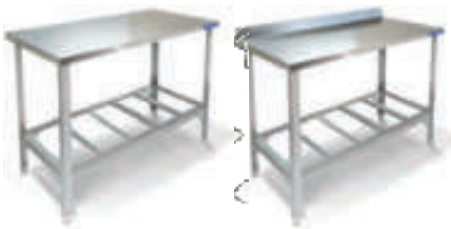
СТОЛ ПРОИЗВОДСТВЕННЫЙ, КАРКАС РАЗБОРНЫЙ – УГОЛОК СТАЛИ AISI 304