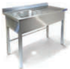
ВАННА МОЕЧНАЯ ЦЕЛЬНОТЯНУТАЯ ОДНОСЕКЦИОННАЯ С КРЫЛОМ ЁМКОСТЬ ИЗ НЕРЖАВЕЮЩЕЙ СТАЛИ AISI 304