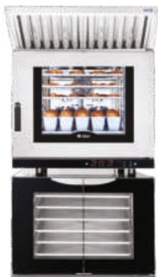
КЭП-6П на ШРТ-12