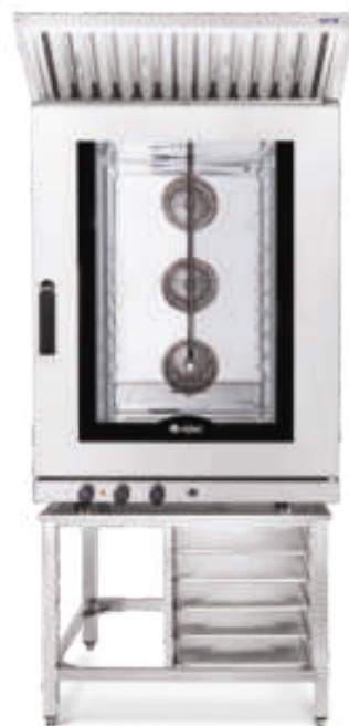
КЭП-10 на ПК-10-6/4