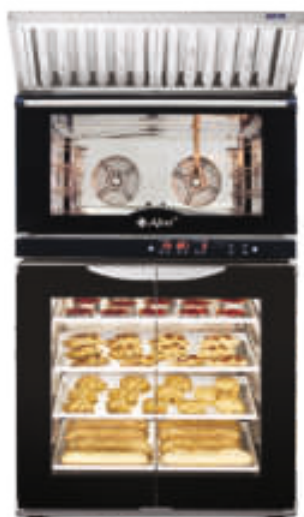
КЭП-4П на ШРТ-8